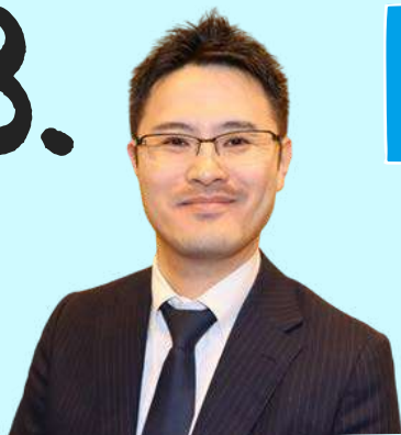
渉外広報委員会 深堀副委員長